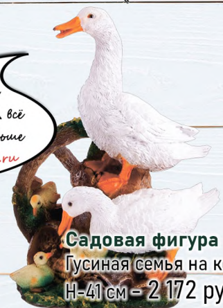
Садовая фигура Гусиная семья на колесе H-41 см - 2 172 руб.

Шашлык можно делать и осенью, ведь уже нет мошек! А всё необходимое и чуть-чуть больше ждёт вас на сайте S-DOM71.ru