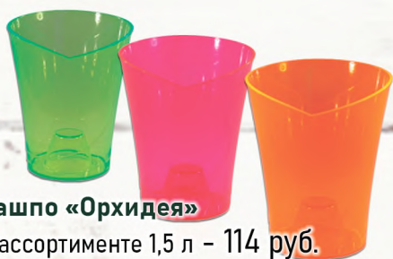
Кашпо «Орхидея» В ассортименте 1,5 л – 114 руб.

Какими бы ни были ваши любимцы – в ДОМСТРОЕ вы найдёте подходящий грунт и кашпо для самых капризных из них. Даже если вы просто решили вырастить на кухне ароматные специи!