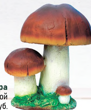
Садовая фигура Гриб белый тройной большой Н-32 см - 996 руб.