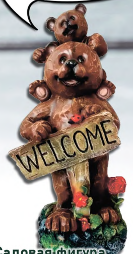
Садовая фигура Медвежата с табличкой Н-46 см - 996 руб.

9 Добавляем шишки, желуди, веточки - и наш венок готов!